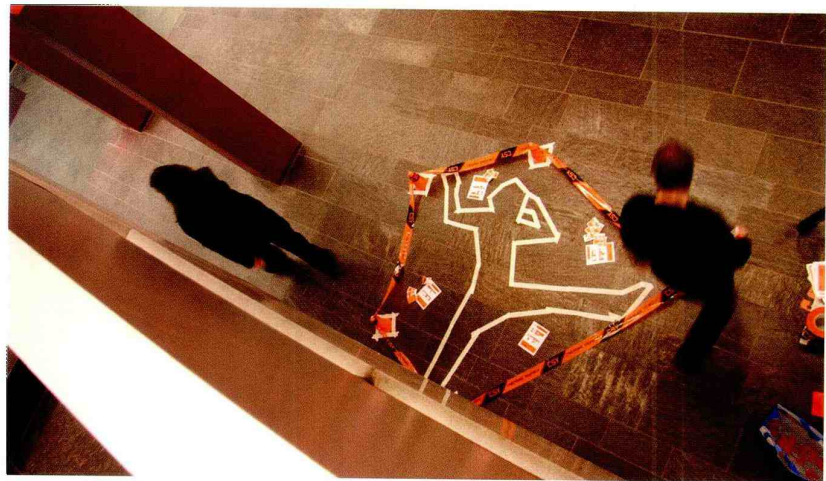
Een manier om aandacht te trekken voor de problematiek en de nieuwe awareness-campagne.